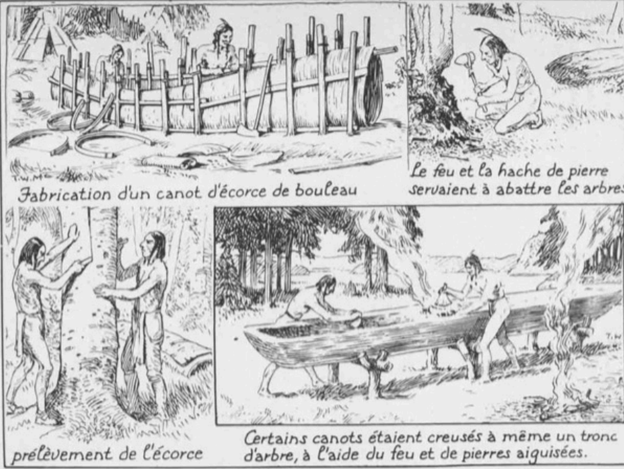
Fabrication d'un canot d'écorce de bouleau

Le feu et la hache de pierre servaient à abattre les arbres.